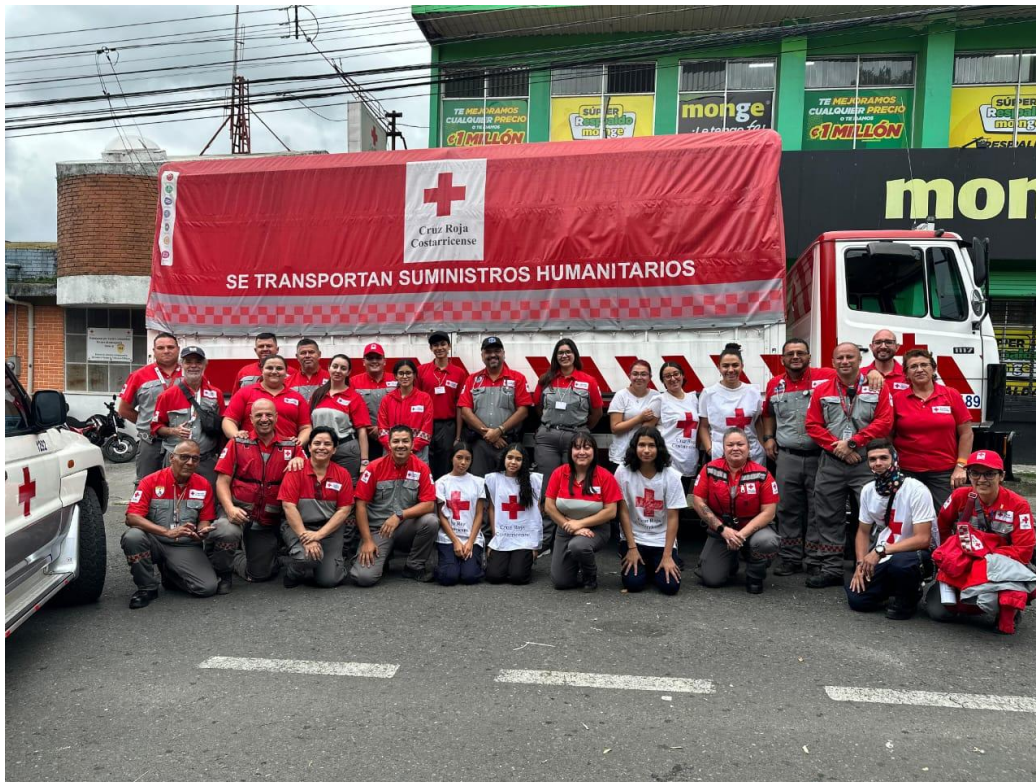
Fotografía 1: Participación en el operativo Romería 2024.

Participación y apoyo en actividades generales de la institución durante el 2024.