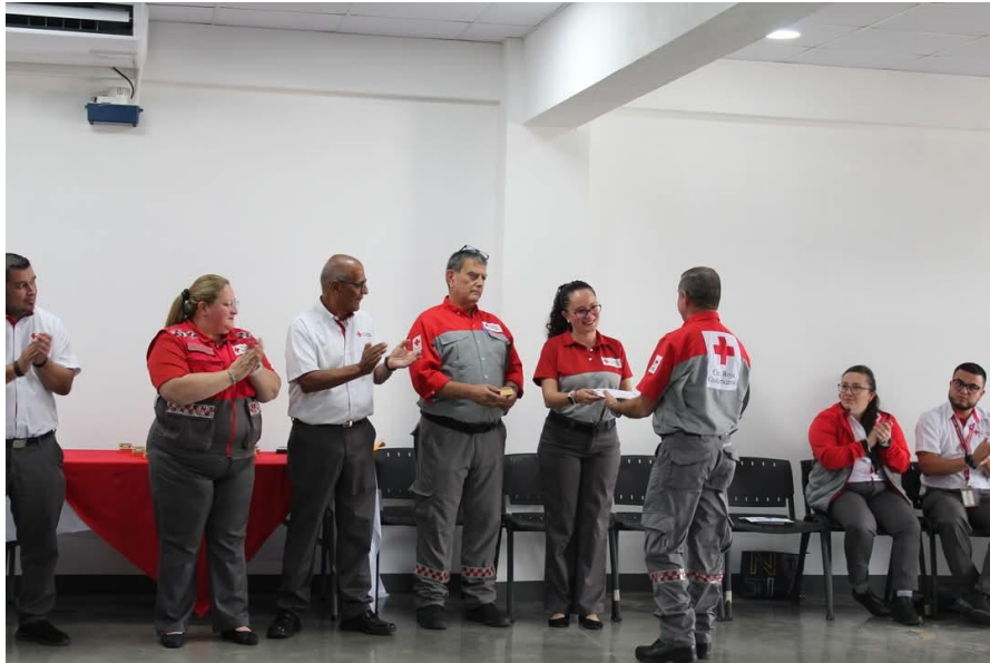
Fotografía 3: Convivencia entre direcciones, jefaturas y Consejo Nacional